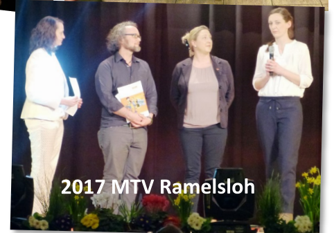
2017 MTV Ramelsloh