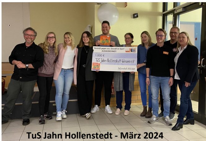
TuS Jahn Hollenstedt - März 2024