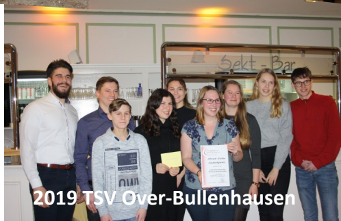
2019 TSV Over-Bullenhausen