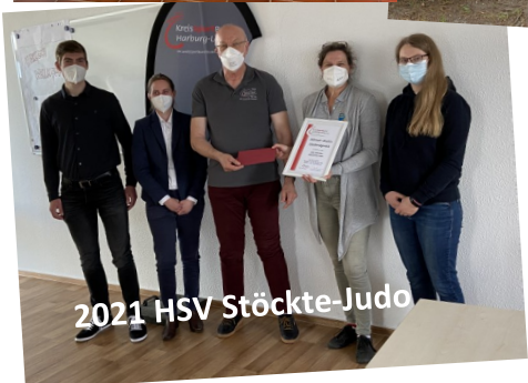
2021 HSV Stöckte-Judo