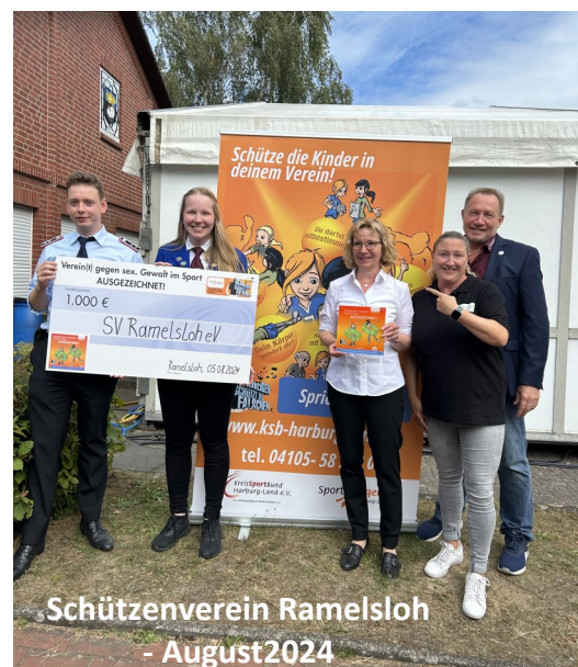
Schützenverein Ramelsloh - August 2024