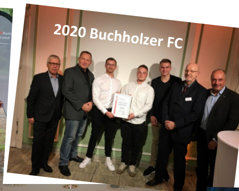
2020 Buchholzer FC