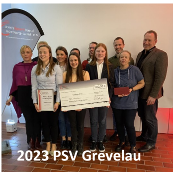
2023 PSV Grevelau

Viele Vereine leisten vorbildliche Arbeit im Kinder- und Jugendbereich. Und es liegt an euch, uns davon zu erzählen. Bewerbungen bitte jeweils zum Jahresende an die KSB Geschäftsstelle.