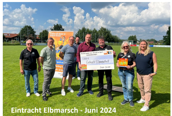
Eintracht Elbmarsch - Juni 2024