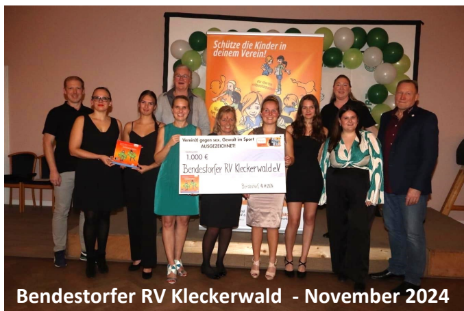
Bendestorfer RV Kleckerwald - November 2024