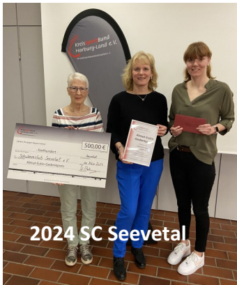
2024 SC Seevetal

Der Almut-Eutin-Gedenkpreis wird jährlich im Rahmen des "Fests des Sports" verliehen.