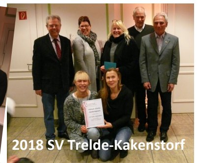
2018 SV Trelde-Kakenstorf