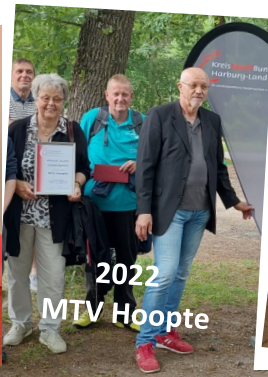
2022 MTV Hoopte